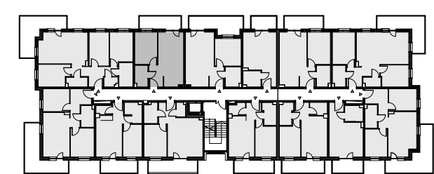
Budynek A - III piętro