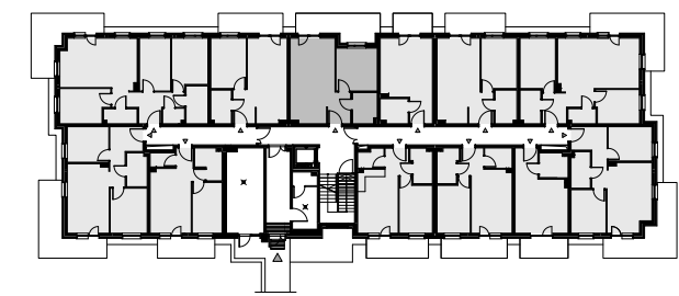
Budynek A - parter