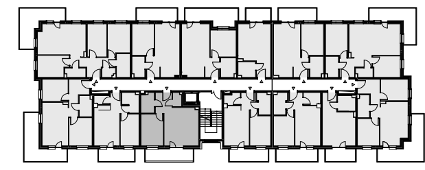
Budynek A - I piętro