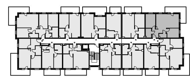
Budynek A - I piętro