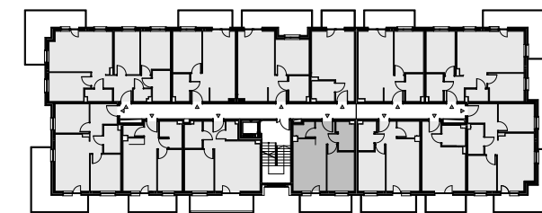
Budynek A - I piętro