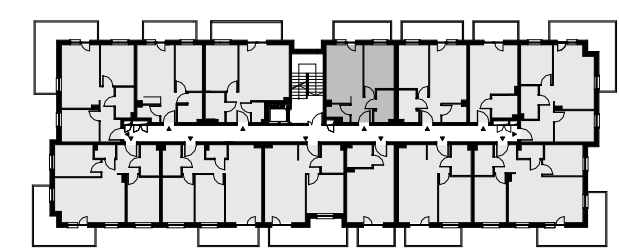
Budynek C - III piętro